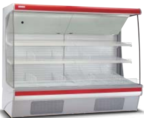
Disponibile versione 3M1. Version 3M1 (meat) available.

* Specchio applicato solo per utilizzo 3H1. Additional mirror only for 3H1 application.